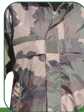
Emplacements grade et nom Grade and Name Locations