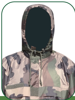
Capuche doublée polaire amovible Removable fur collar