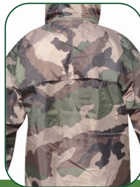
Aérations dans le dos Vents in the back