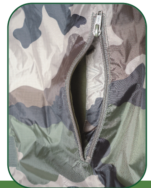
Poches extérieures (doublées polaire) Outside pockets (Polar fabric)