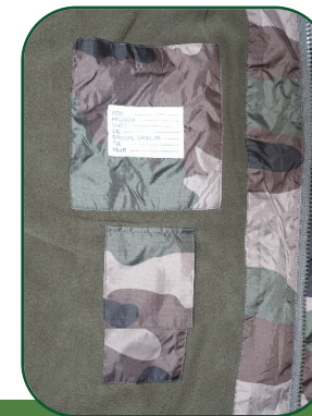
Poches intérieures Inside pockets